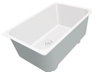
Weißer Wanne 8153 100